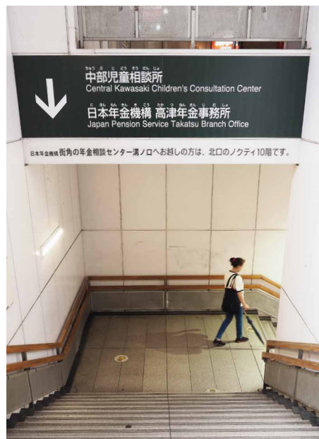
表示板サイズ：3300xH880 表示方法：フラットグラフィックスシート印刷