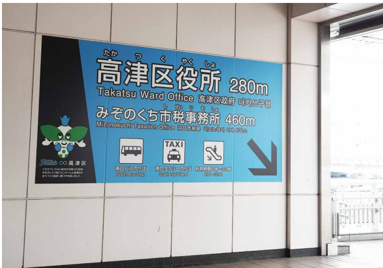
表示板サイズ：W3800xH1880 表示方法：フラットグラフィックスシート印刷