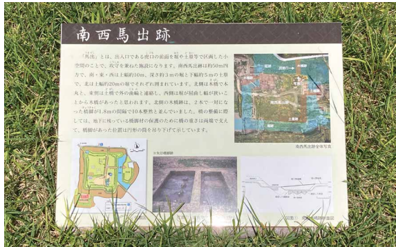
表示板サイズ：W590xH430 表示方法：スーパーカラー BR110 印刷