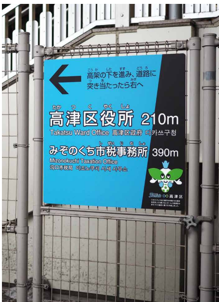
表示板サイズ：W770xH770 表示方法：スーパーカラー R 印刷