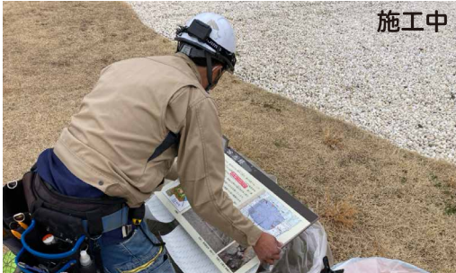
表示板サイズ：W595xH430 表示方法：スーパーカラー BR110 印刷