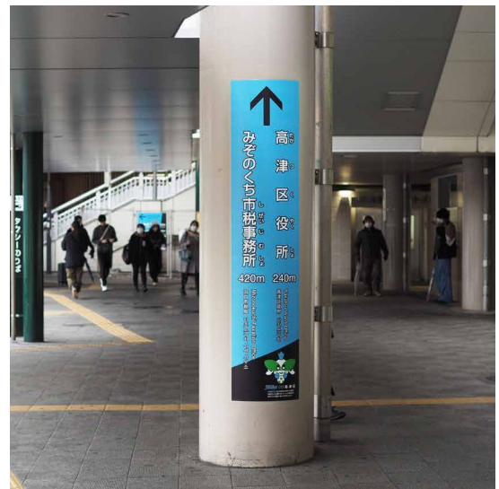
表示板サイズ：W440xH1900 表示方法：フラットグラフィックスシート印刷