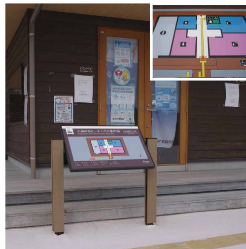
表示板サイズ：W900xH600 表示方法：ハイブリッドカラー印刷（触知図） 本体素材：アルミ押出形材+リサイクルウッド