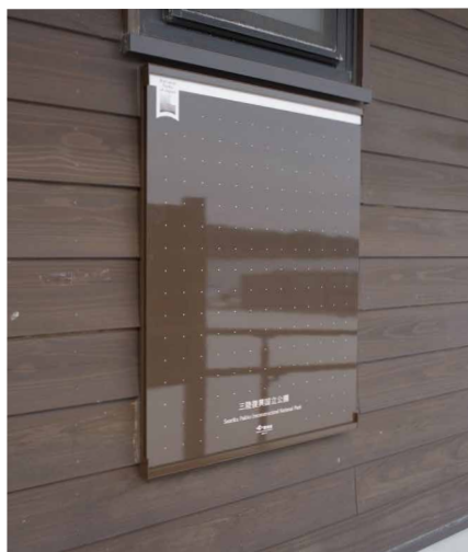
表示板サイズ：W700xH900 表示方法：スーパーカラー R 印刷