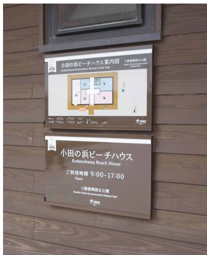
表示板サイズ：W700xH450 表示方法：スーパーカラー R 印刷