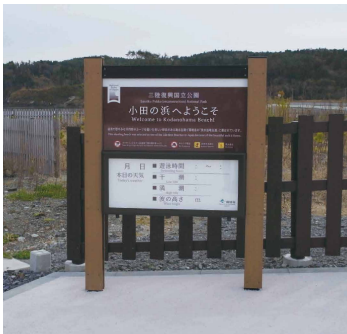
表示板サイズ：上部 W900xH450 下部 W900xH400（掲示板） 表示方法：スーパーカラー BR60 印刷 本体素材：アルミ押出形材+リサイクルウッド