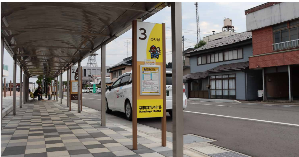
表示板サイズ：W450xH1500 表示方法：スーパーカラー R印刷 本体素材：リサイクルウッド