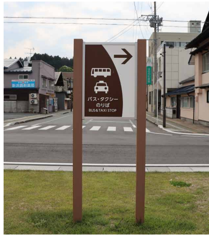
表示板サイズ：W582xH840 表示方法：スーパーカラー R印刷 本体素材：リサイクルウッド