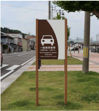
表示板サイズ：W600xH890 表示方法：スーパーカラー R印刷 本体素材：リサイクルウッド