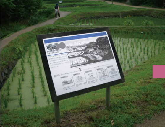
当初あった水田の解説板（モノクロ）