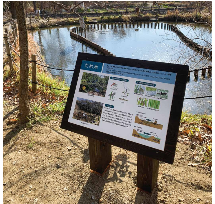
表示板サイズ：W600xH400 表示方法：スーパーカラー BR60 印刷 本体素材：国産杉材