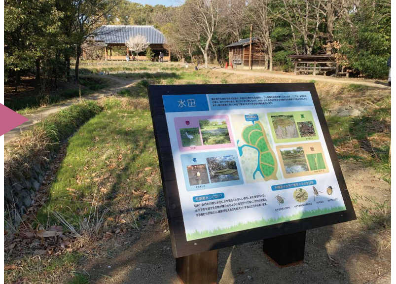
表示板サイズ：W800xH600 表示方法：スーパーカラー BR60 印刷 本体素材：国産杉材