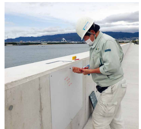
バックベースの取り付け