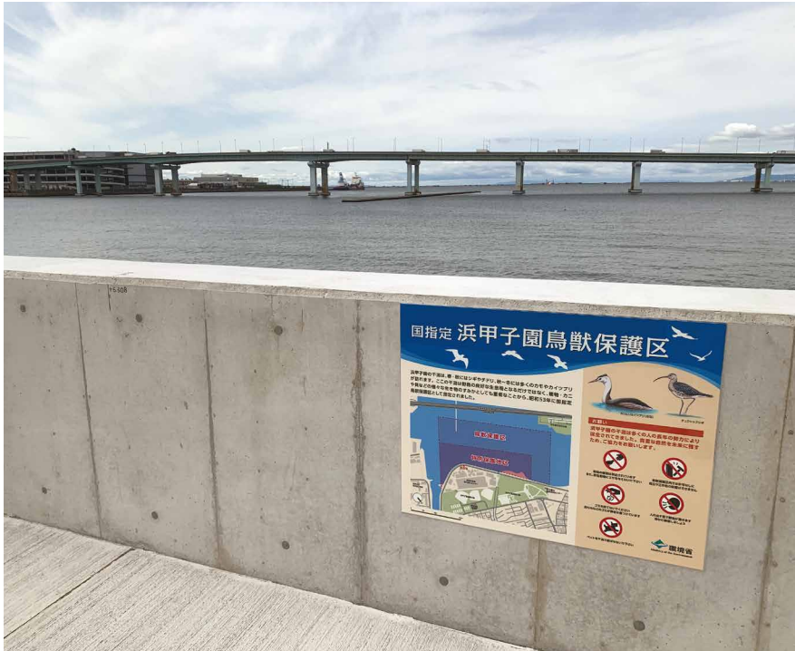
防波堤の先はすぐ干潟で季節には多くの野鳥が見られる