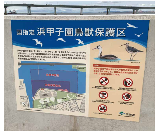
海と野鳥をイメージした涼やかなデザイン