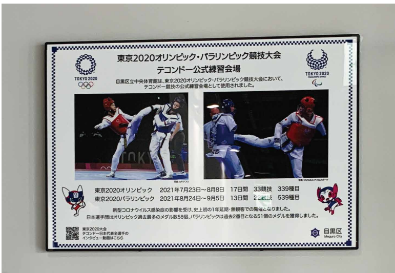
解説サイン 表示板サイズ：W750xH500 表示方法：ハイブリッドカラー印刷 本体素材：アルミ押出形材