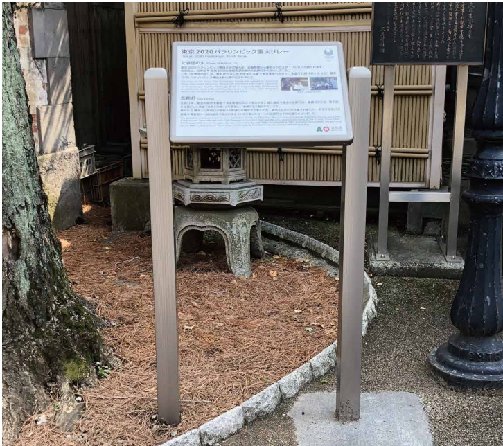
解説サイン 表示板サイズ：W500xH350 表示方法：スーパーカラー S 印刷（触知図） 本体素材：アルミ押出形材