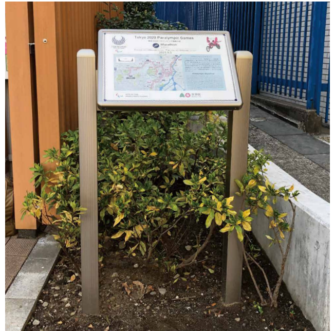
解説サイン 表示板サイズ：W500xH350 表示方法：スーパーカラー S 印刷 （触知図） 本体素材：アルミ押出形材