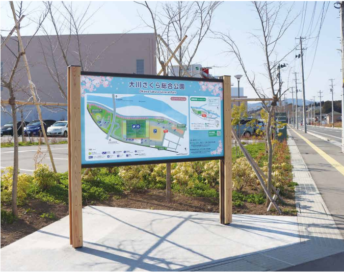
表示板サイズ：W1800xH900 表示方法：スーパーカラー BR110 印刷 本体素材：アルミ押出形材+国産杉材