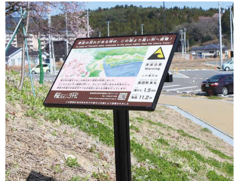
表示板サイズ：W400xH300 表示方法：スーパーカラー R 印刷 本体素材：アルミ押出形材