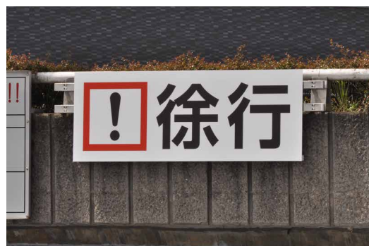
表示板サイズ：W2300xH850 表示方法：スーパーカラー R 印刷