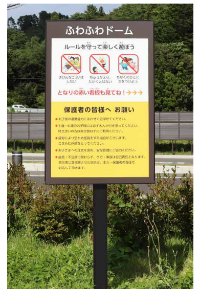
表示板サイズ：W590xH890 表示方法：スーパーカラー R 印刷 +フッ素ラミネート 本体素材：アルミ押出形