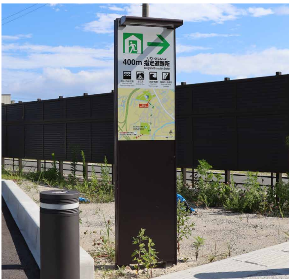
表示板サイズ：W450xH900 表示方法：スーパーカラー R 印刷+フッ素ラミネート 本体素材：アルミ押出形材+ソーラー LED ライト