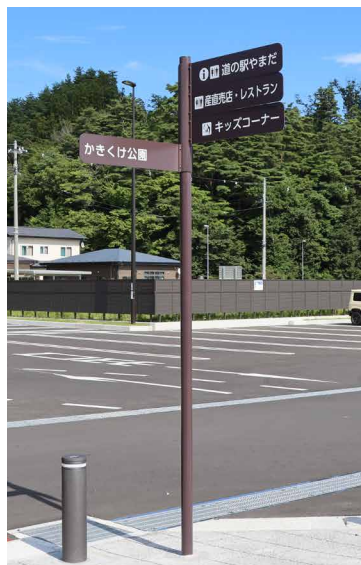
表示板サイズ：W800xH180 表示方法：スーパーカラー R 印刷 +フッ素ラミネート 本体素材：ステンレス