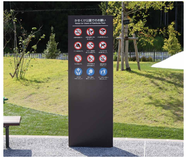
表示板サイズ：W600xH1800 表示方法：スーパーカラー R 印刷+フッ素ラミネート 本体素材：アルミ押出形材