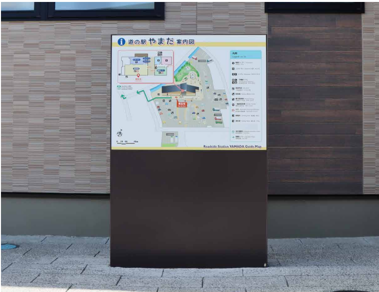
表示板サイズ：W1200xH900 表示方法：スーパーカラー R 印刷+フッ素ラミネート 本体素材：アルミ押出形材