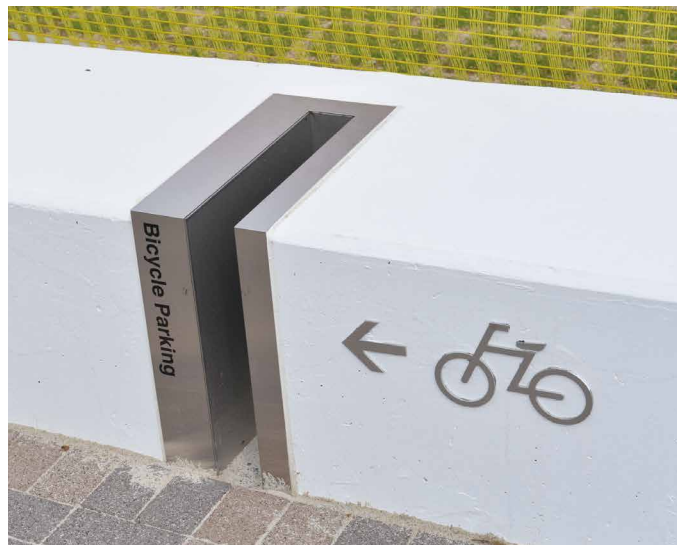
表示板サイズ：W350xH138 表示方法：ステンレス切文字