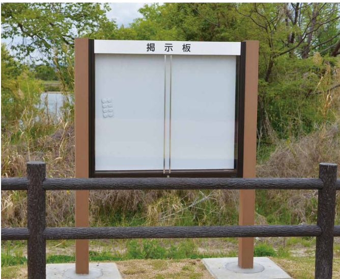
掲示板サイズ：W1096xH893 表示方法：スーパーカラー R 印刷 本体素材：リサイクルウッド