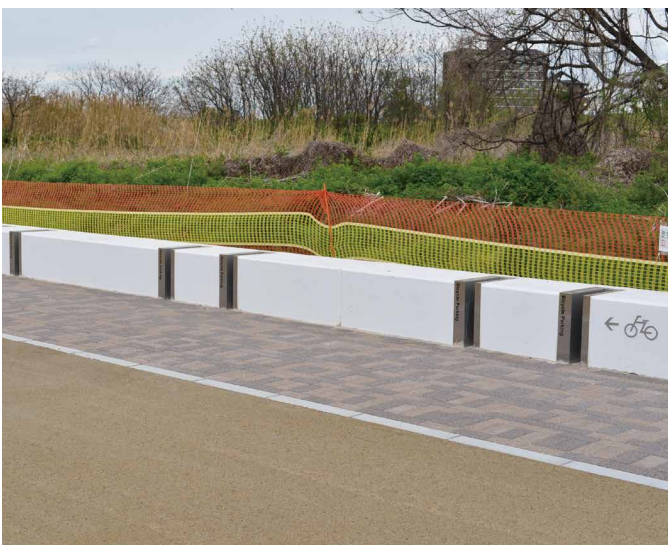
表示板サイズ：W90xH453 表示方法：エッチング 本体素材：ステンレス