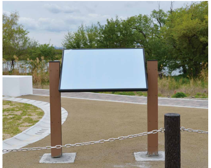
表示板サイズ：W884xH584 本体素材：リサイクルウッド 表示はまだ空白ですが、地域の皆さまが考えた内容が掲載される日を楽しみに待っています！