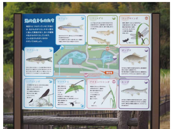
表示板サイズ：W1200xH900 表示方法：スーパーカラー R 印刷 本体素材：アルミ押出材材+リサイクルウッド