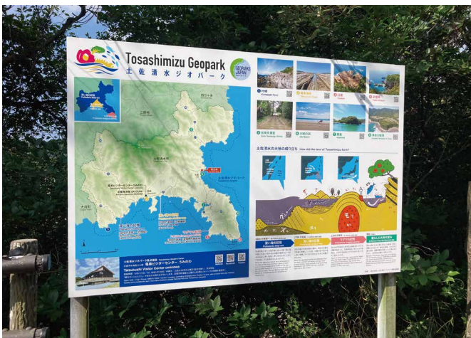
表示板サイズ：W1800xH1200 表示方法：スーパーカラー R 印刷