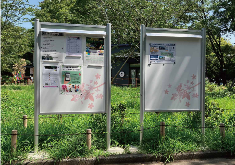
掲示板サイズ：W900xH1200 表示方法：スーパーカラー R 印刷 本体素材：アルミ押出形材