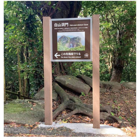
表示板サイズ：W600xH600 表示方法：スーパーカラー R 印刷 本体素材：リサイクルウッド