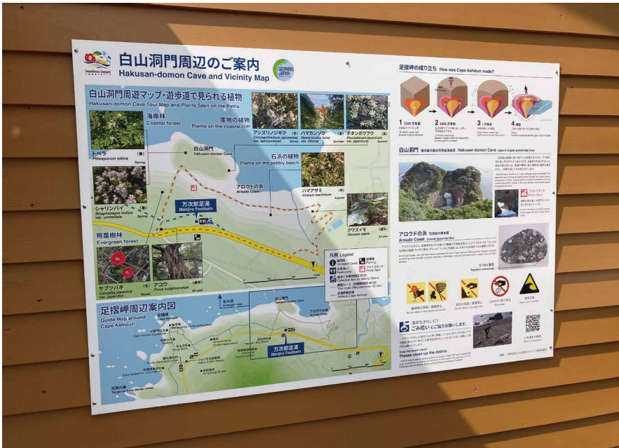
表示板サイズ：W1800xH1200 表示方法：スーパーカラー R 印刷