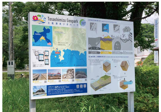
表示板サイズ：W1800xH1200 表示方法：スーパーカラー R 印刷