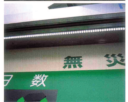
三菱ガス化学(株)水島工場内のサイン 企画・デザイン・設計・製作・施工：(株)タテシ広美社