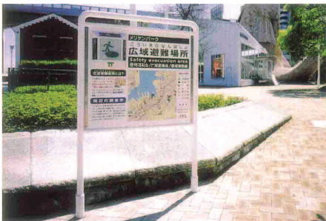
太陽光発電式避難場所発光サイン「ソーラービクト」 発売元：リントック(株)