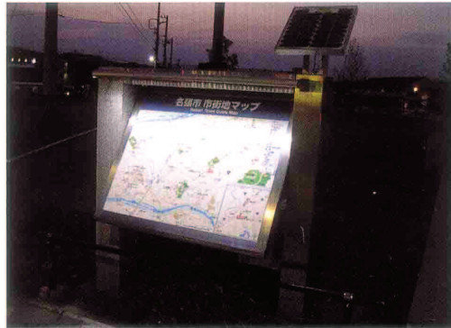
名張市モニュメント・観光サイン 製作・施工：(株)勝造形企画、企画・デザイン・設計・製作・施工：(株)アピックス