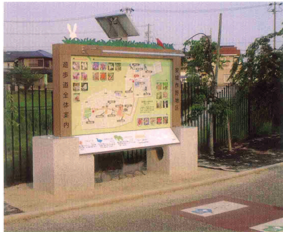
安城市「作野四季の道」のサイン 製作・施工：工房 光、企画・デザイン・設計・製作・施工：(株)アピックス