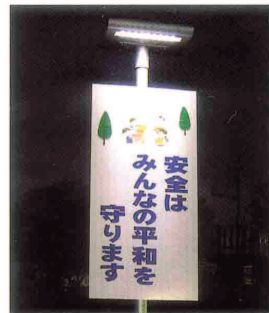
防犯ユニットサイン 発売元：(株)宣サイン