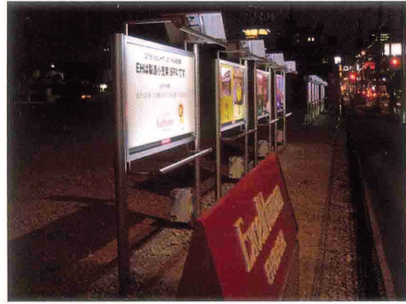
大阪府堺市のEH(株)企業広告 企画：(株)日豊社、製作・施工：(株)フジ広告社、ソーラー発電システム部材販売元：(株)サインモール 環境負荷軽減、省エネに早くから取り組んでいるEH(株)で、省エネソーラー発電「ハバサンシステム」が11台採用された。