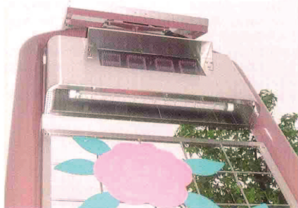
福山南ロータリークラブのモニュメント 企画・デザイン・設計・製作・施工：(株)タテシ広美社