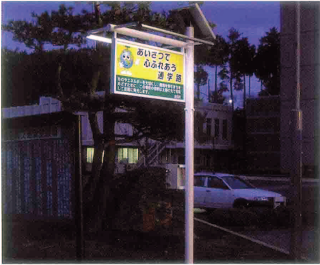
長野県波田町役場内のサイン ソーラー発電システム開発・施工：(株)アピックス、ソーラー発電システム部材販売元：(株)サインモール