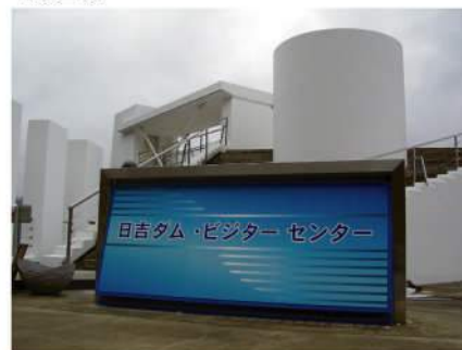
ビジターセンターのデザインコンセプトに沿ったサインに