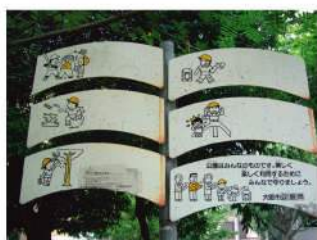
赤色が退色し、正しい表示ができていない

■長く使用されたサインは様々な修繕が必要になります。修繕をすることで最新の情報を利用者に案内できます。