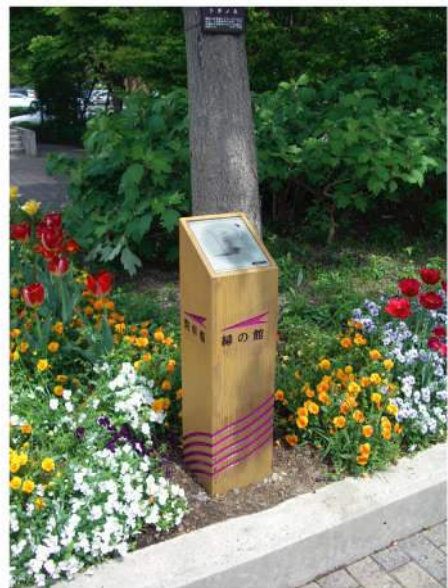
■ 宇治市植物園 道標 本体：杉材 印刷：アボフォト印刷