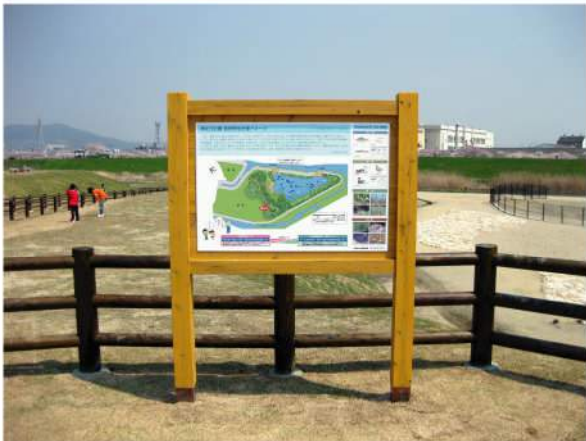
■ 津之江公園ビオトープサイン 本体：杉材 印刷：スーパーカラーR+ABコート