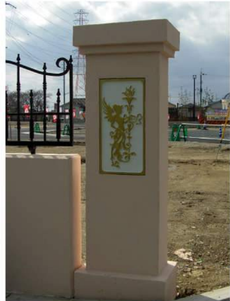
■ 住宅販売場レリーフ 本体：鋳物