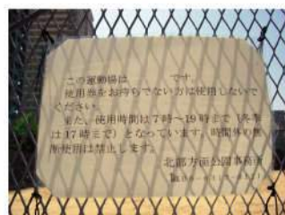
パウチでの作成では退色が早く、赤色が消えてしまっている