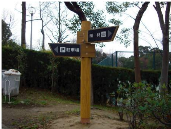
■ 荒山公園サイン 本体：国産杉材 印刷：アボフォト