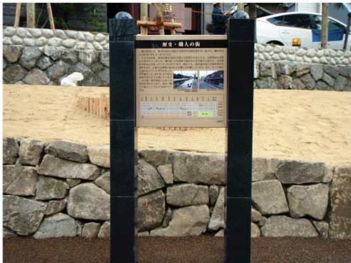
本体：御影石(黒) 印刷：ハイブリッドカラー