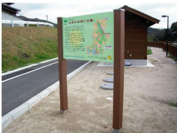
■ 山田ふれあい公園サイン 本体：合成木材 印刷：スーパーカラーR+ABコート