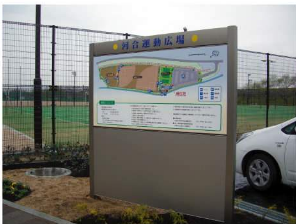
■ 小野市河合運動公園サイン 本体：アルミ押出型材 印刷：スーパーカラー+ABコート