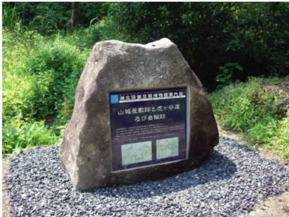
■ 田園空間サイン 印刷：スーパーカラー+ABコート