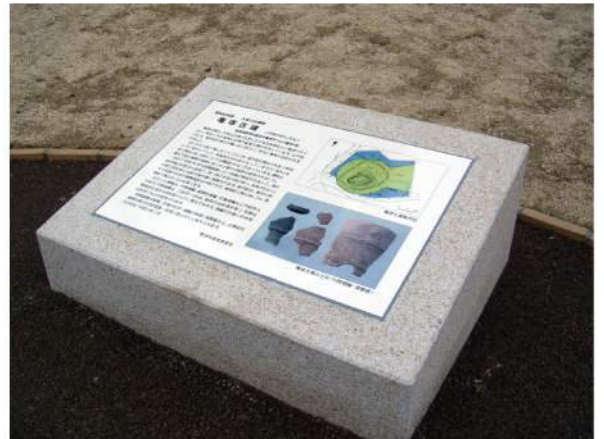
■ 亀岡古墳サイン 印刷：陶板