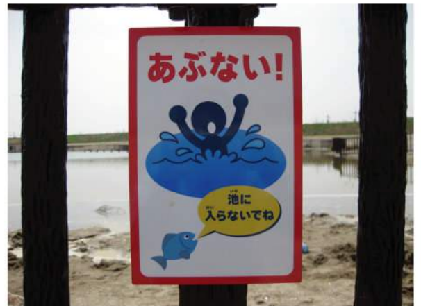
■ 津之江公園注意サイン 本体：アルミ 印刷：スーパーカラーR+ABコート