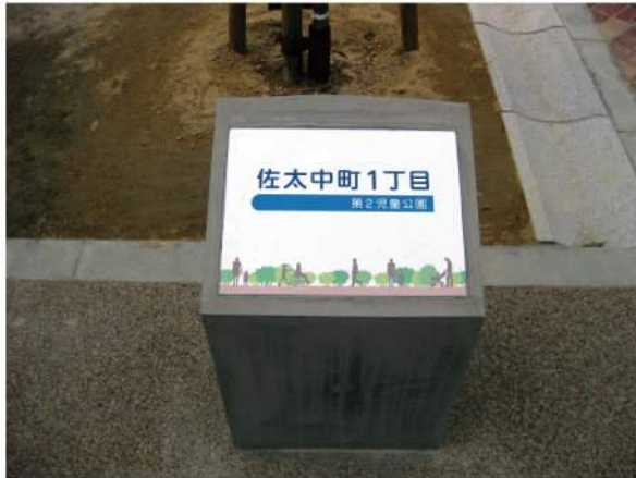
■ 佐太中町1丁目公園園名サイン 印刷：ハイブリッドカラー