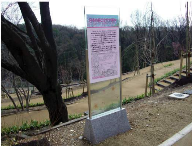
本体：桜御影石 印刷：スーパーカラーR