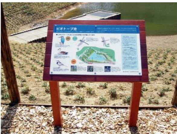
■ 住友ゴム白河工場ビオトープサイン 本体：杉材 印刷：ハイブリッドカラー