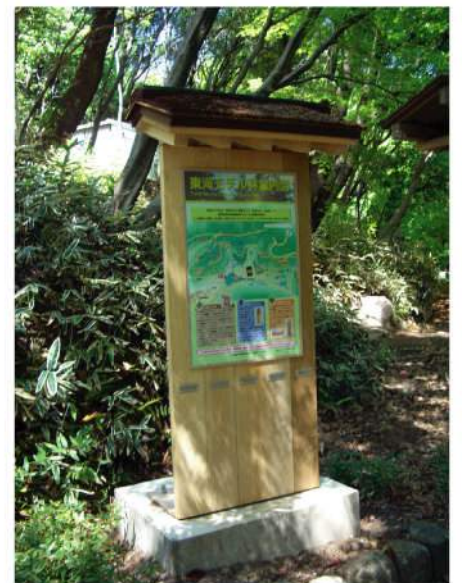
本体：木曾五木材・檜皮 印刷：スーパーカラーR