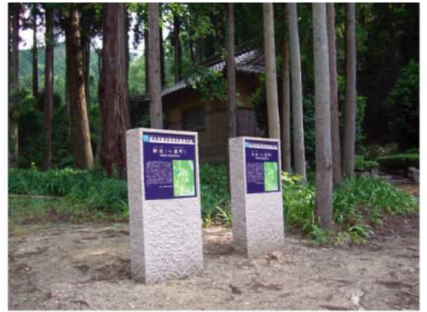
■ 田園空間サイン 印刷：スーパーカラー+ABコート