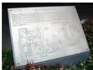
内容に沿った印刷方法でなく、情報が見えにくい