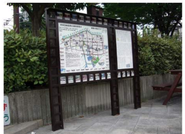
■ 土居川河川サイン 本体：SUS 印刷：ハイブリッドカラー