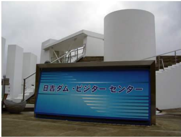
■ 日吉ダムビジターセンターサイン 印刷：ハイブリッドカラー