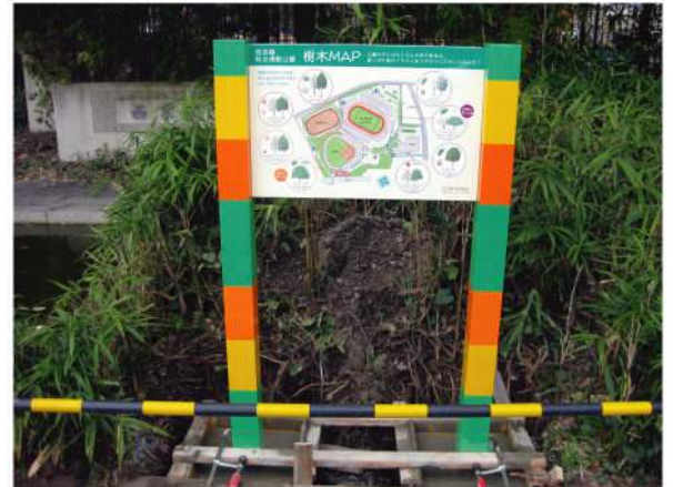
■ 西京極総合運動公園案内サイン 本体：カラーラブロック 印刷：ハイブリッドカラー