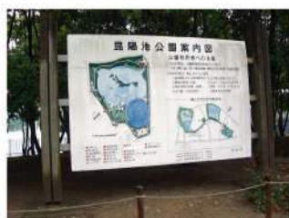
情報が古く、更新の必要がある