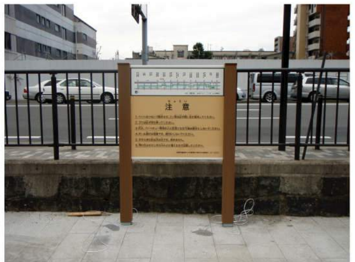
本体：合成木材 印刷：ハイブリッドカラー