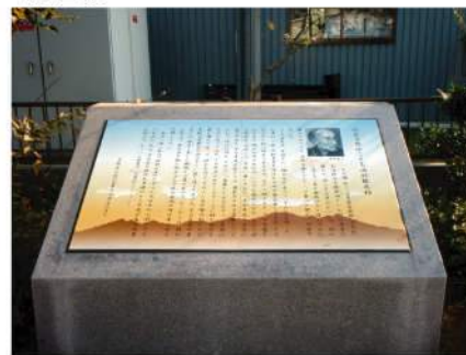
色の劣化や衝撃に強く、耐候性の高い印刷に