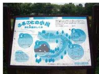
イラストが全体的に青く変色し、わかりにくくなっている