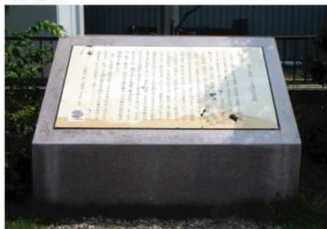
いたずらにより表示板が割られた状態