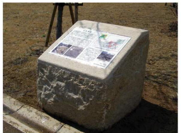
■ 水笠遺跡公園サイン 本体：御影石 印刷：ハイブリッドカラー