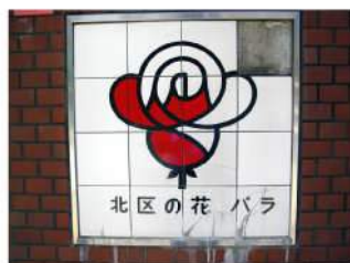
いたずらで割られおり、危険