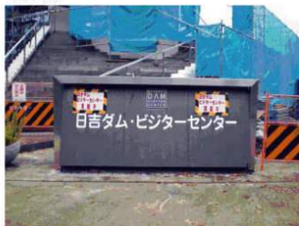
ビジターセンターのリニューアルに伴い、サインの改修も必要に