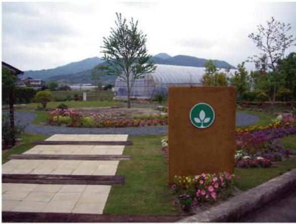
■ 亀岡市緑花協会様サイン 印刷：スーパーカラーR