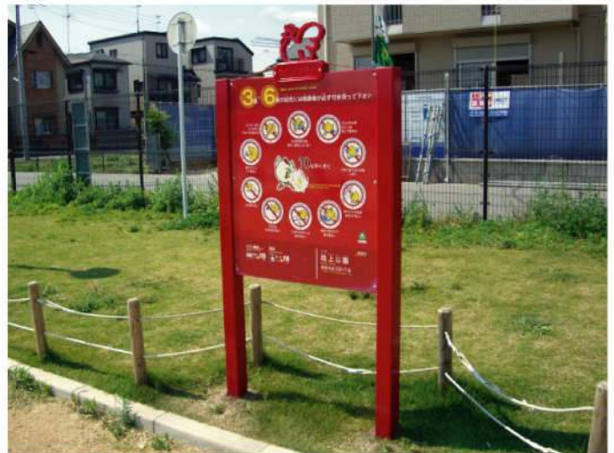
2本脚（スチール）タイプ