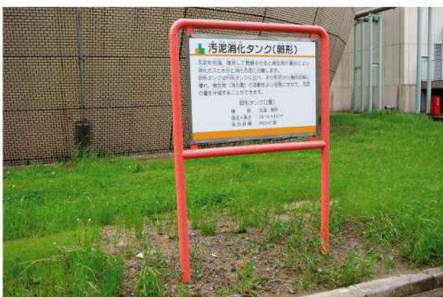
印刷：スーパーカラーR+ABコート