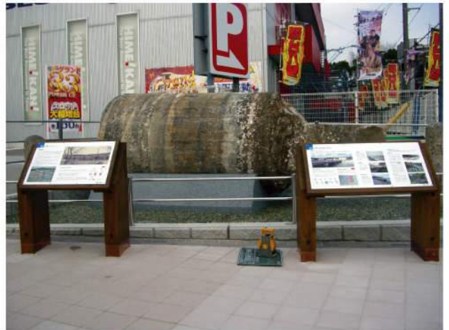
本体：木 印刷：スーパーカラーR+ABコート