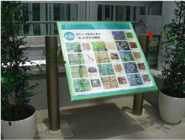
本体：アルミ押出形材 印刷：ハイブリッドカラー印刷