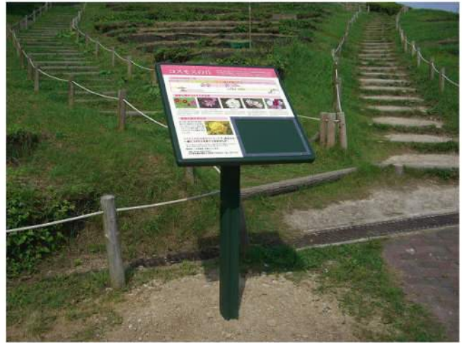
本体：アルミ押出形材 印刷：ハイブリッドカラー印刷