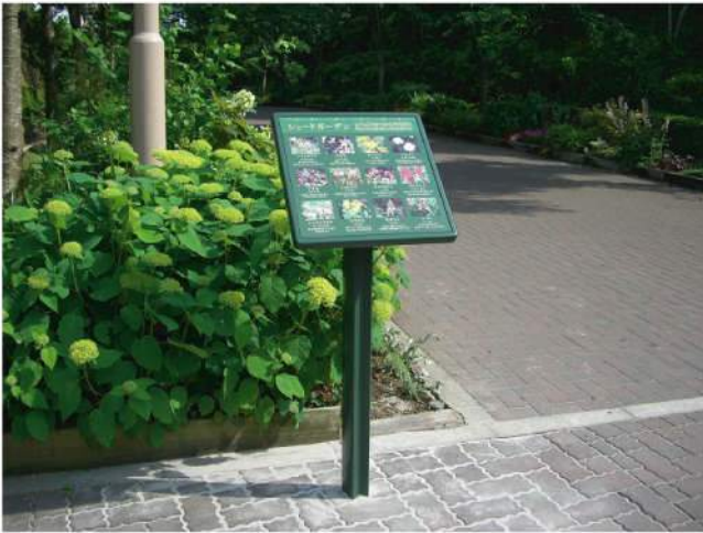
本体：アルミ押出形材 印刷：ハイブリッドカラー印刷