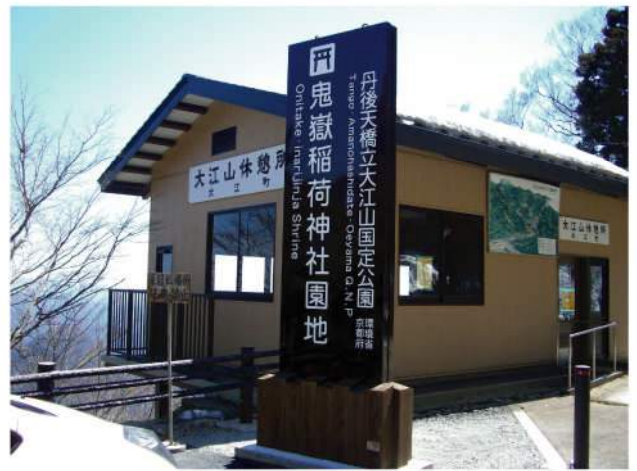
本体：SUS+木 印刷：SUS切文字