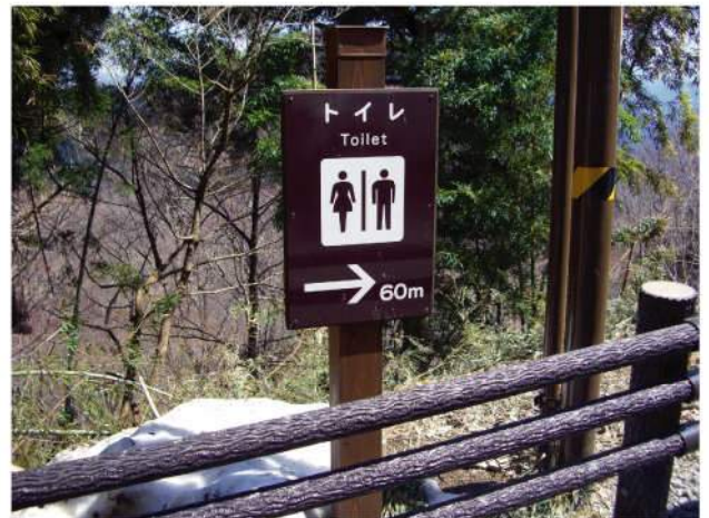
本体：木 印刷：スーパーカラーR+ABコート