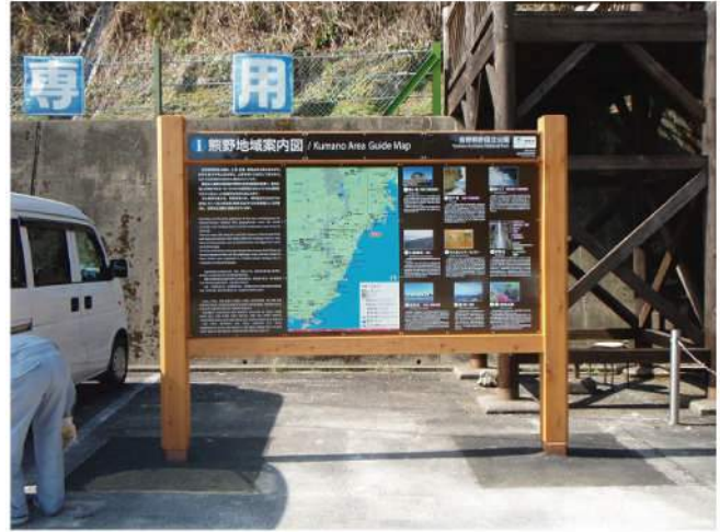
本体：三重県産桧材 印刷：スーパーカラーR+ABコート