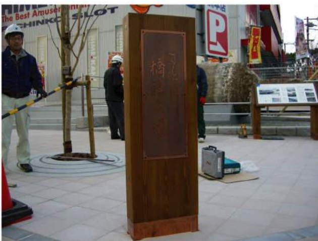
本体：木 印刷：銅板エッチング