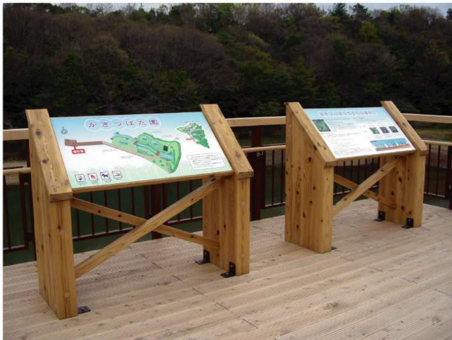
本体：木 印刷：ハイブリッドカラー印刷