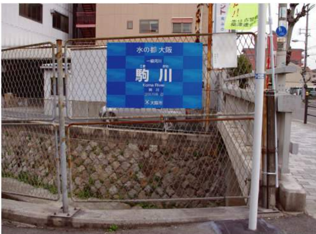
印刷：スーパーカラーR