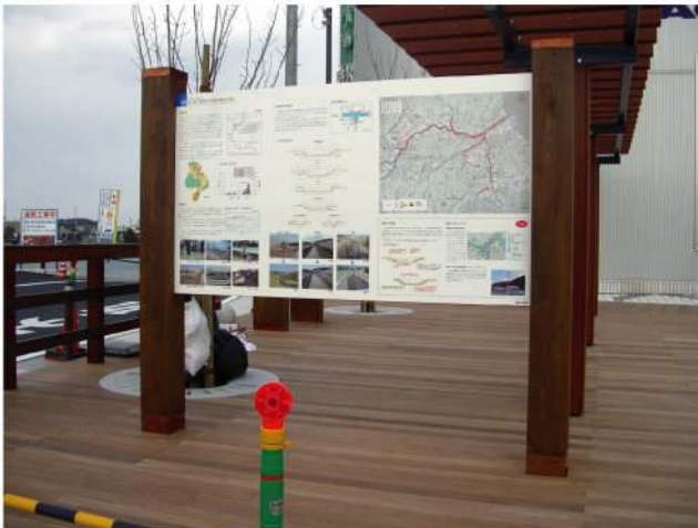
本体：木 印刷：スーパーカラーR+ABコート