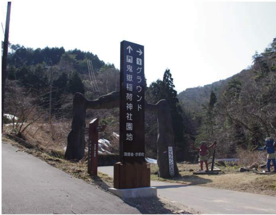
本体：SUS+木 印刷：SUS切文字