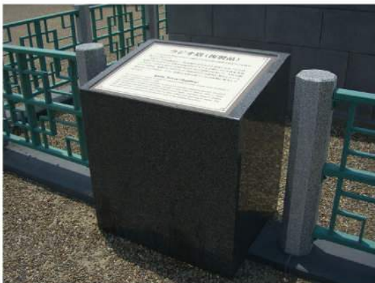
本体：御影石 印刷：ハイブリッドカラー印刷