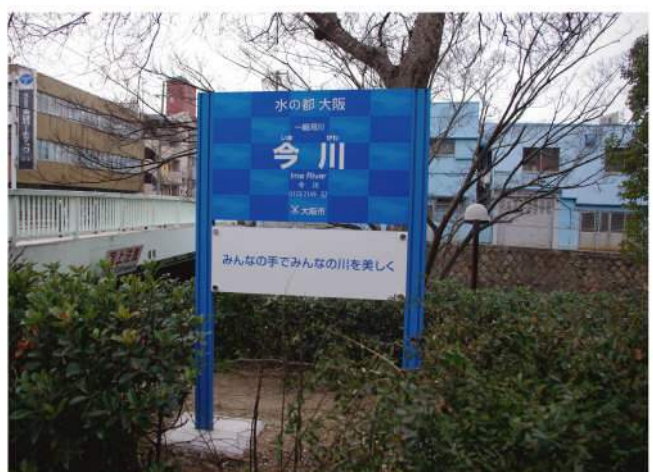
本体：アルミ押出形材 印刷：スーパーカラーR