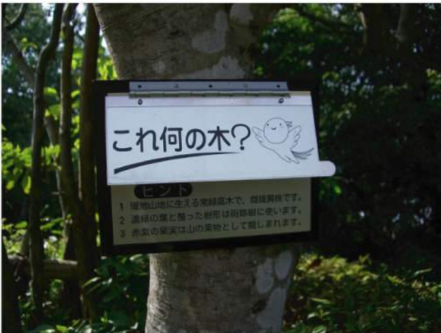
本体：再生樹脂+アルミ 印刷：アポフォト印刷