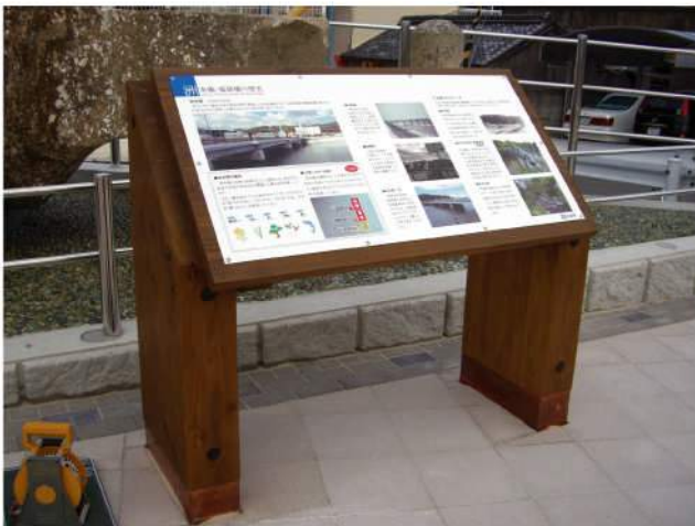
本体：木 印刷：スーパーカラーR+ABコート