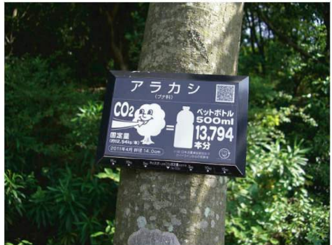
本体：再生樹脂 印刷：アボレーザー印刷