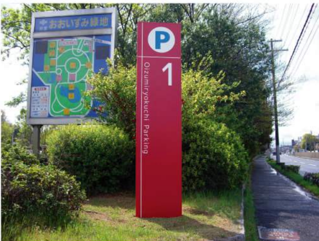
本体：アルミ押出形材 印刷：カッティングシート