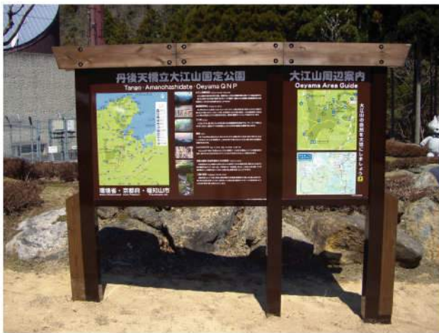
本体：SUS+木 印刷：スーパーカラーR+ABコート