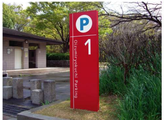
本体：アルミ押出形材 印刷：カッティングシート