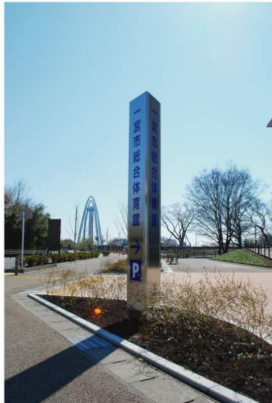
本体：アルミ押出形材 印刷：カッティングシート