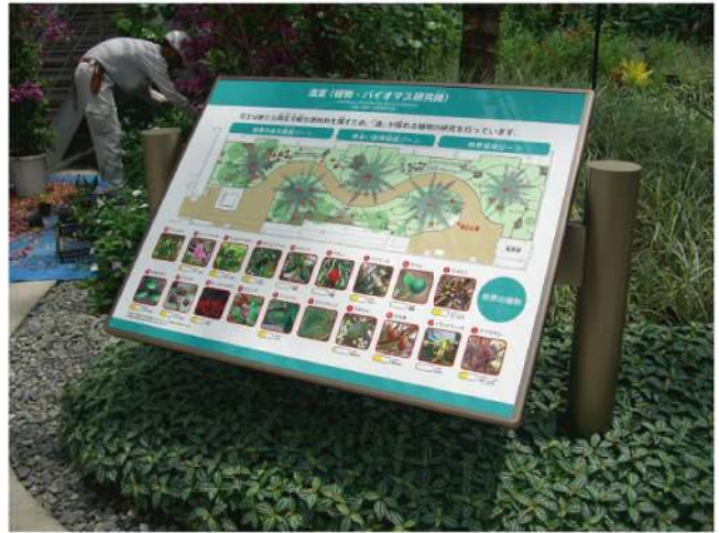
本体：アルミ押出形材 印刷：ハイブリッドカラー印刷