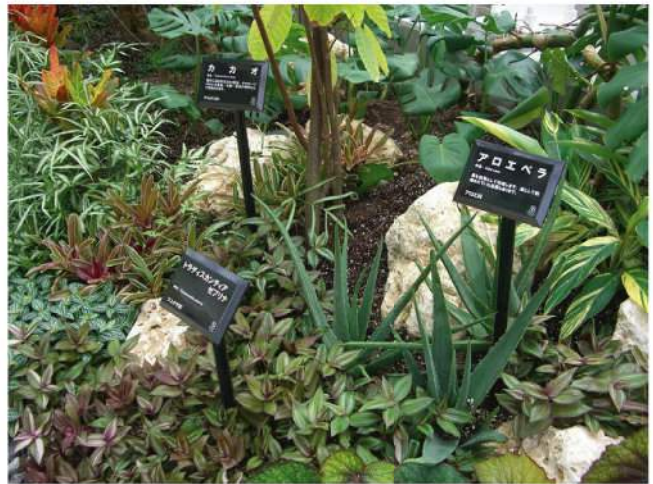
本体：再生樹脂 印刷：アボレーザー印刷