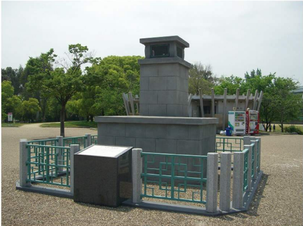
本体：御影石・鋼管（エージング仕上）