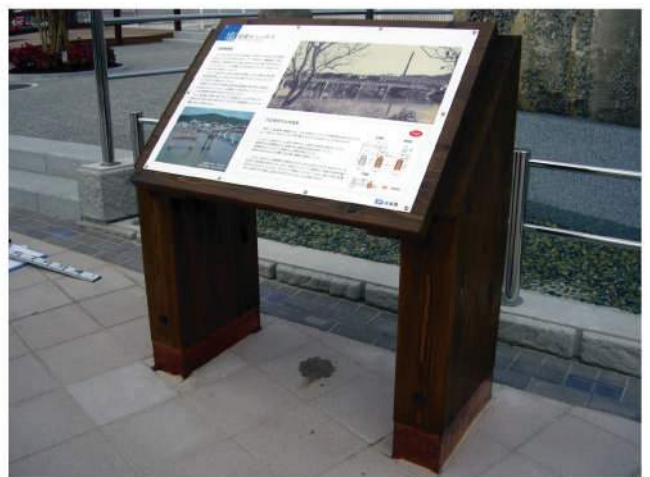
本体：木 印刷：スーパーカラーR+ABコート