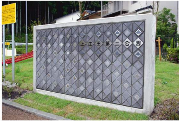
本体：コンクリート・瓦 印刷：SUSエッチング