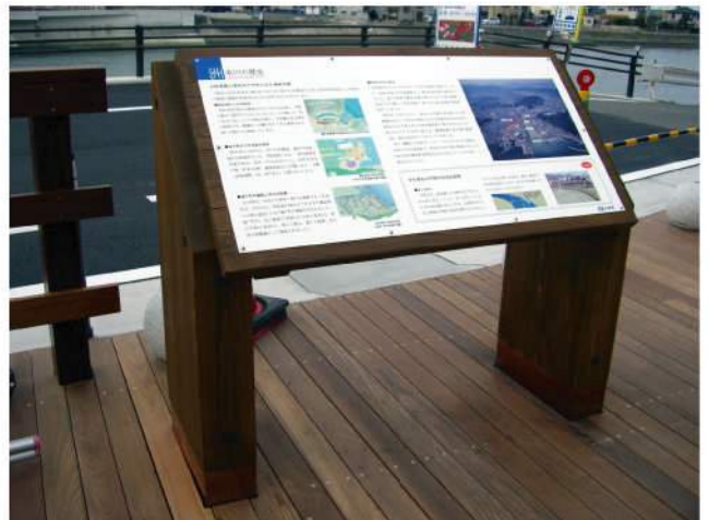
本体：木 印刷：スーパーカラーR+ABコート