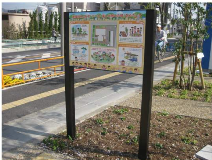
本体：アルミ押出形材 印刷：スーパーカラーR印刷