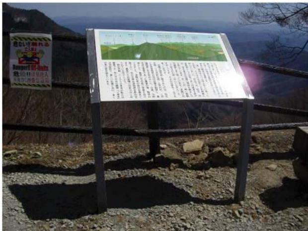
印刷：ハイブリッドカラー印刷