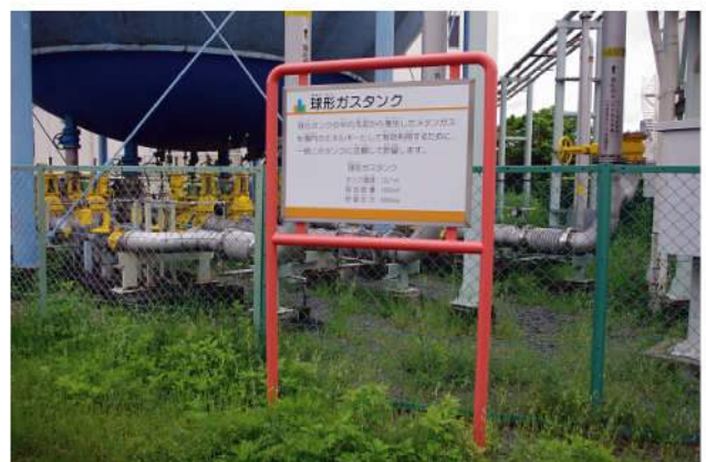
印刷：スーパーカラーR+ABコート