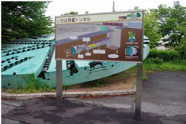
本体：SUS(HL) 印刷：スーパーカラーR+ABコート