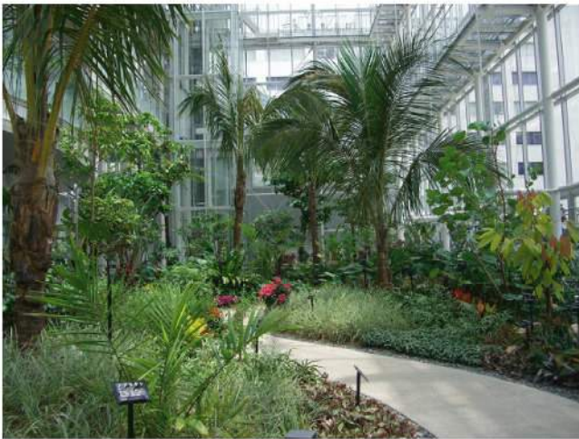
本体：再生樹脂 印刷：アボレーザー印刷