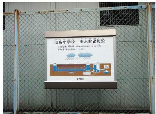
本体：アルミ押出形材 印刷：ハイブリッドカラー印刷