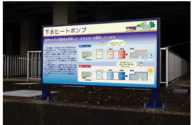
本体：SUS(HL) 印刷：スーパーカラーR+ABコート