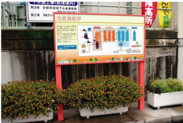
本体：SUS(HL) 印刷：スーパーカラーR+ABコート