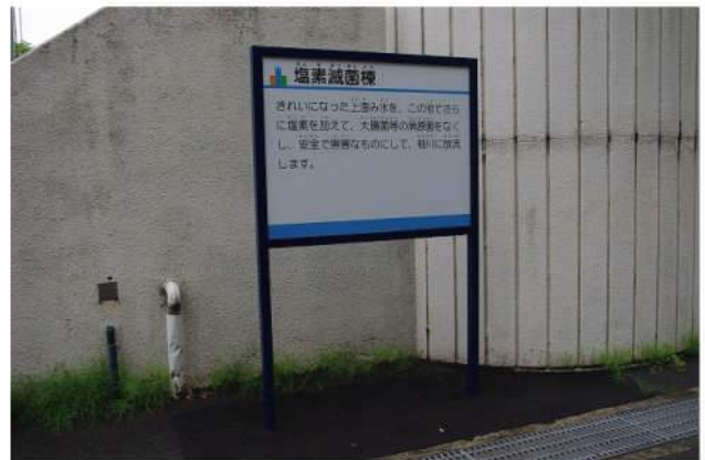
本体：SUS(HL) 印刷：スーパーカラーR+ABコート