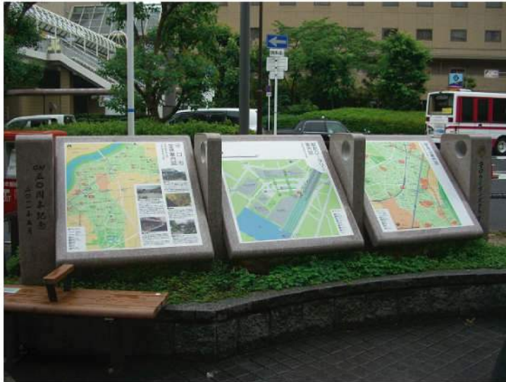
印刷：スーパーカラーR印刷