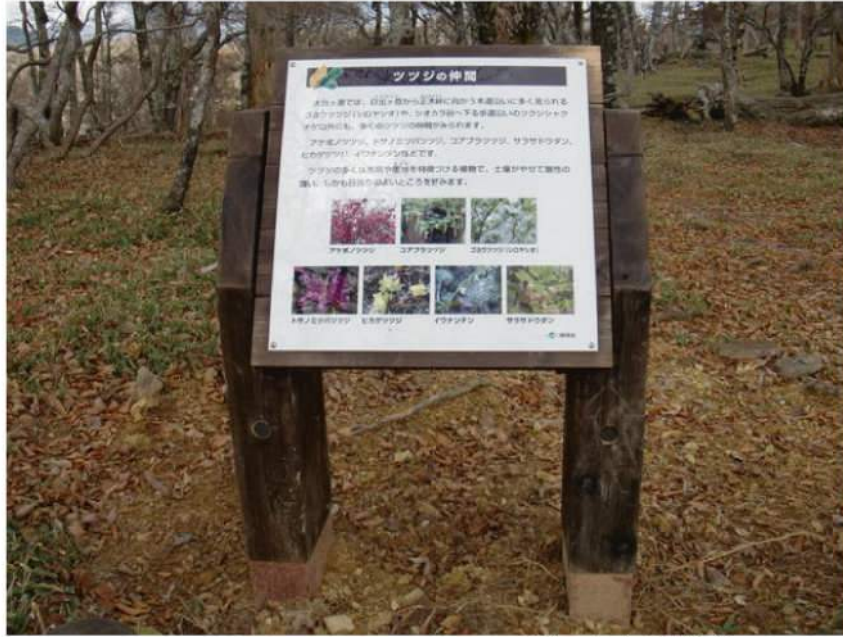
本体：奈良県産松材 印刷：ハイブリッドカラー印刷