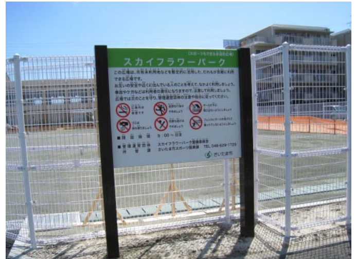
表示; W1.200 × H1.000mm スーパーカラー R 制札ピクト表示 支柱; ラブロック L1419 (改) 型 H1.760mm