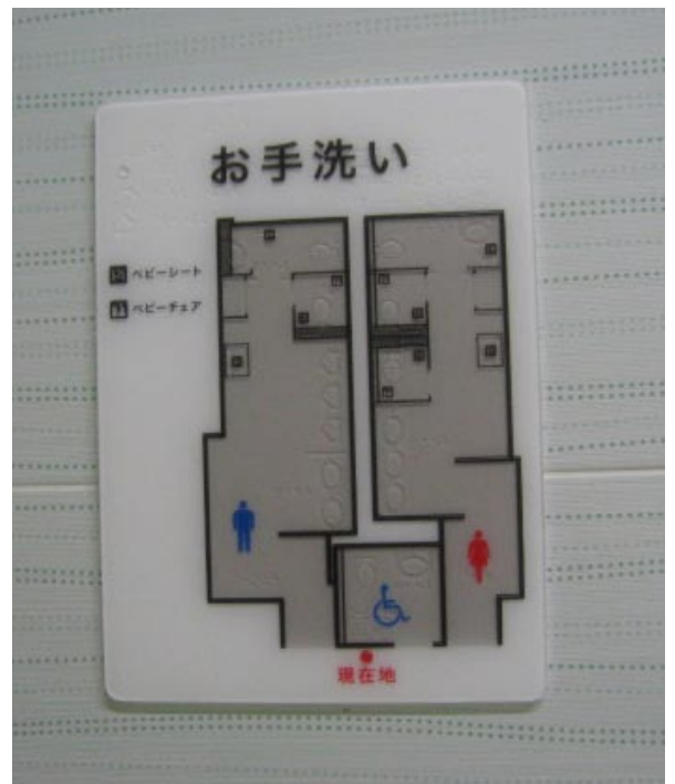
点字手洗所設備票 250 × 350mm