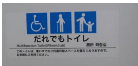
だれでもトイレ利用標 350 × 220mm インクジェット