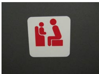
ベビーチェア利用標 150 × 150mm インクジェット