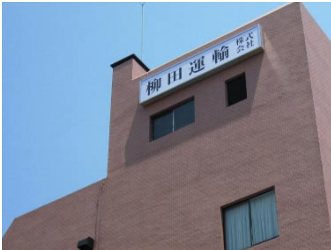
ファザード看板本体 H900 × W4.000 × D125mm シート切文字貼 内照式-LED モジュール