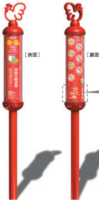
C 1本脚円筒形サイン 品番 JPFA-SAS-02